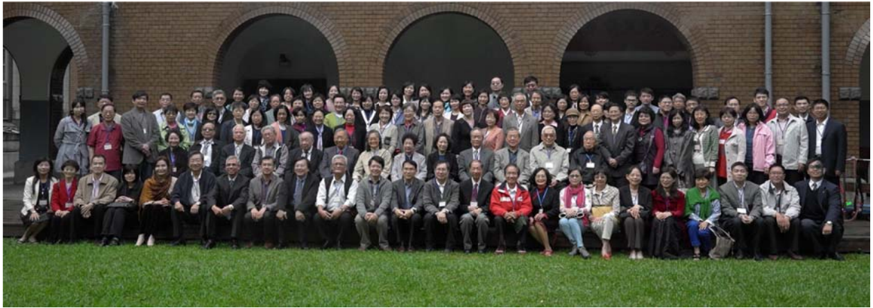
臺大中文系七十週年系慶活動，師長及系友合影於文學院中庭。