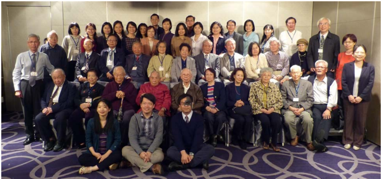
臺大中文系七十週年系慶餐會，合影於水源會館。