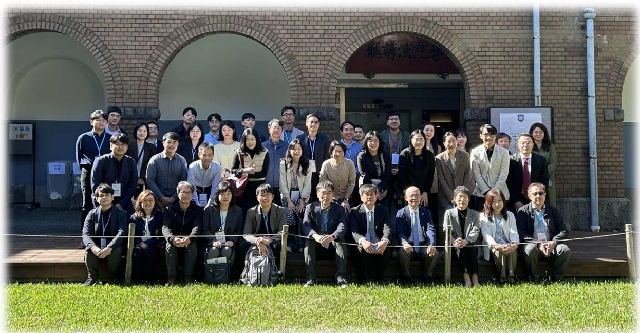
【11月29日2025年韓國漢文學會冬季國際學術大會（臺大場）學者合影】